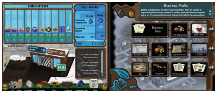
Pantallas del simulador de negocios GoVenture.

La simulación debe estar precedida de una fase de entrenamiento más profunda, para disminuir los errores y riesgos en las operaciones y en los resultados.